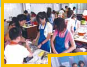
可風好煮意烹飪班