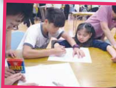
探訪智障學童院舍 (協助中四級學生)