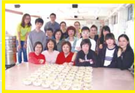
敬老活動 - 步步糕昇傳耆康親子活動