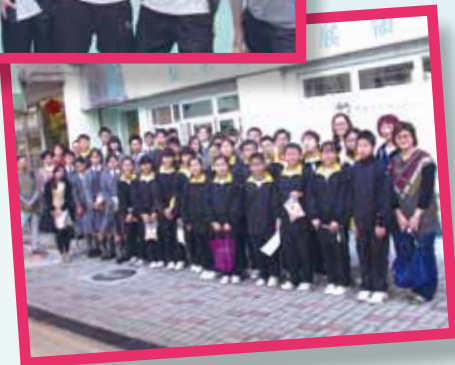
探訪梨木樹邨獨居長者 (協助中一學生)