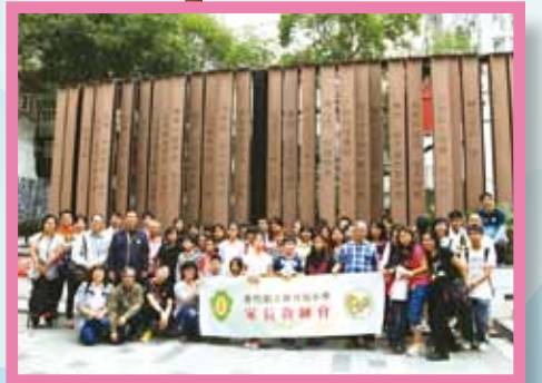
香港史蹟徑學術考察