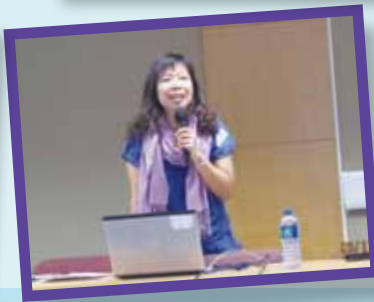
圖書館家長義工工作坊