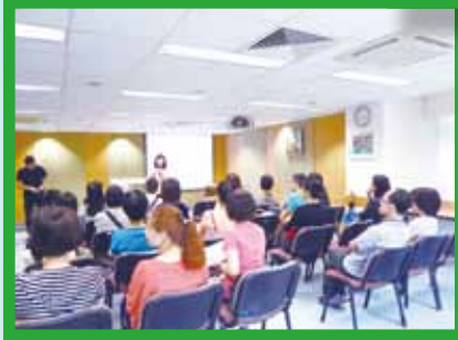
家長義工茶聚暨交流工作坊