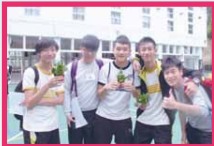
探訪梨木樹邨獨居長者 (協助中五學生)