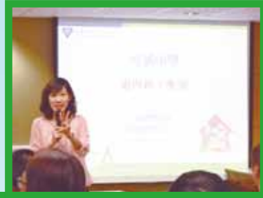
家長工作坊 - 子女溝通