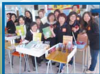
家教會校內年宵攤位